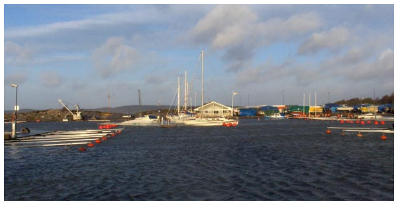
Ganska lungt i södra hamnen